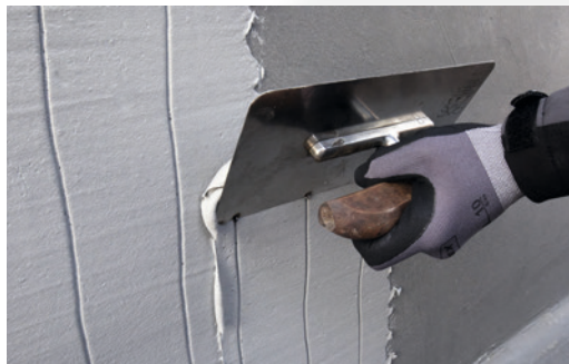
Du erreichst spielend leicht perfekte Ergebnisse dank cremiger Materialkonsistenz.