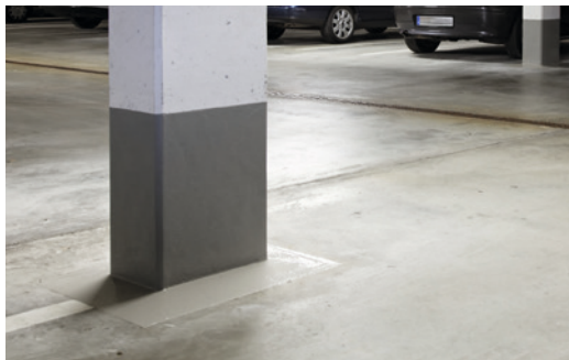
Zuverlässiger Schutz von Betonbauteilen als Oberflächenschutzsystem OS 5b.