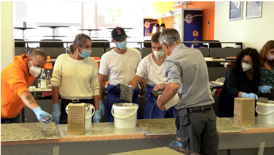
Das beliebte Seminar „Bauchemie zum Anfassen“ am PCI-Standort Augsburg ( Link zum hochauflösenden Photo)