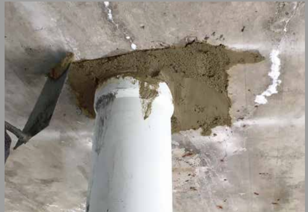
Dank seiner guten Standfestigkeit lässt sich PCI Nanocret® R4 Rapid perfekt über Kopf verarbeiten.