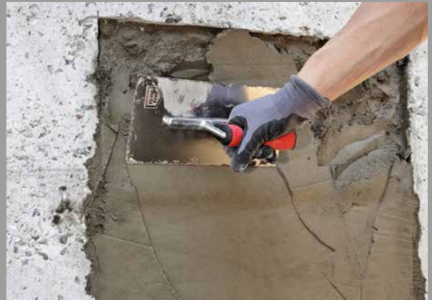
PCI Nanocret® R4 Rapid ist gut zu verarbeiten, zu modellieren und garantiert den schnellen Fortschritt auf der Baustelle, auch bei tiefen Temperaturen.